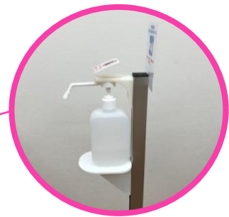
ボトルのサイズに合わせて調整可能です