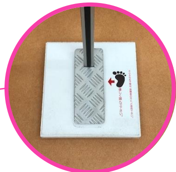
スタンドが転倒しない様に重い土台を使用しています

足踏み式消毒スタンドを導入する事で、ちょっとしたテーブルを入口に用意する事なく、場所もとりません。何と言っても足でポンプを押す事が出来るので、感染するのでは、という不安を覚える事なく手を消毒する事が出来ます。